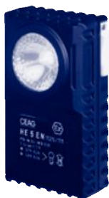
HE 5 EN